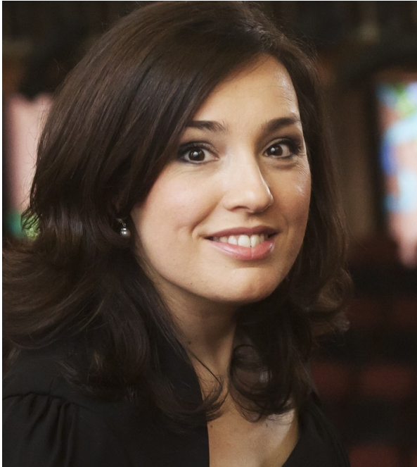
ELENA COPONS, soprano

http://www.agenciacamera.com/sites/agenciacamera/files/field/download/bio_elena_copons.pdf