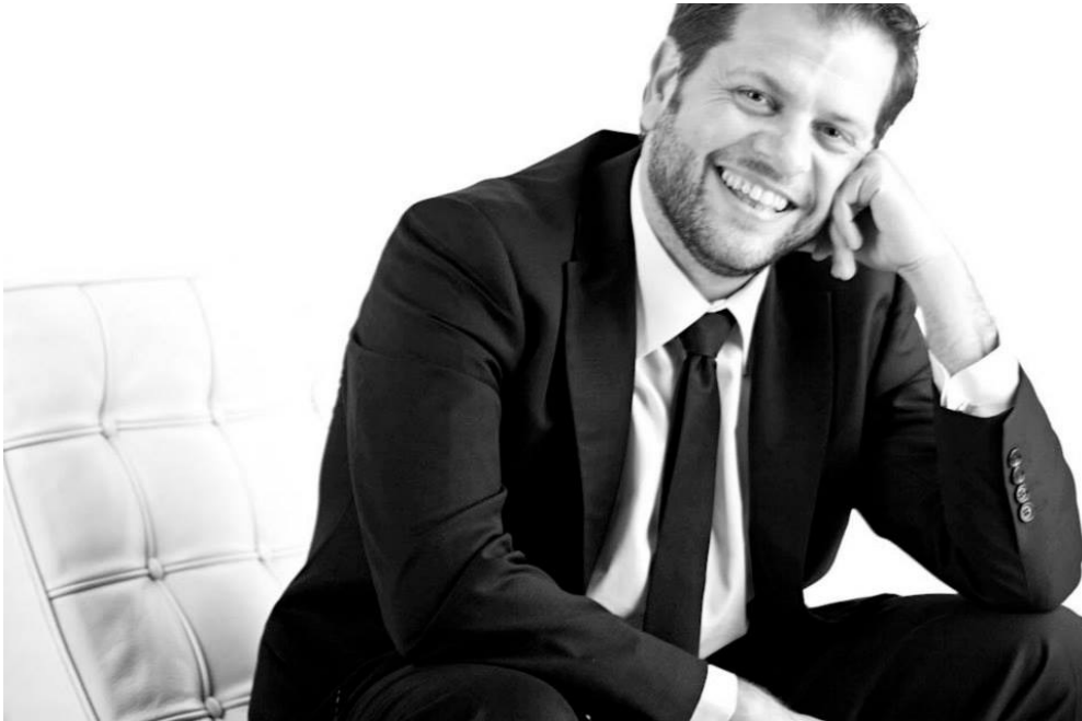
ROGER PADULLÉS, tenor

Escoltar: https://youtu.be/n3jTBWlwMRc · https://youtu.be/eY9YfCmBTU8